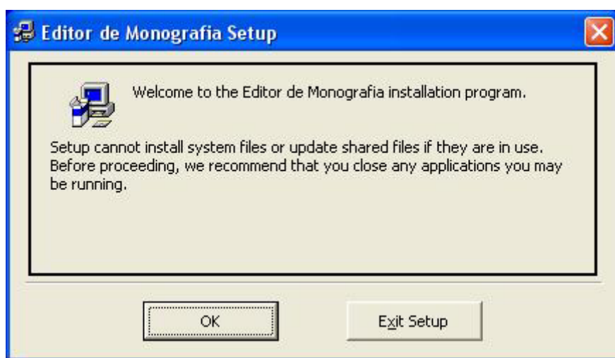
Figura 1. Tela inicial da instalação do software.

O primeiro passo para o processo de instalação do “Editor de Monografias” é fazer o download do arquivo compactado editor_monografia.zip disponível a partir do endereço http://www.sergio.pro.br/editor_de_monografias . Feito o download é necessário fazer a descompactação dos arquivos, será criada uma pasta chamada Editor de Monografia – Instalador. Dentro desta pasta deverá ser executado o arquivo setup.exe. Na primeira tela (Figura 1) deverá ser clicado em OK para continuar iniciar a instalação, ou em Exit Setup para abortar a instalação.