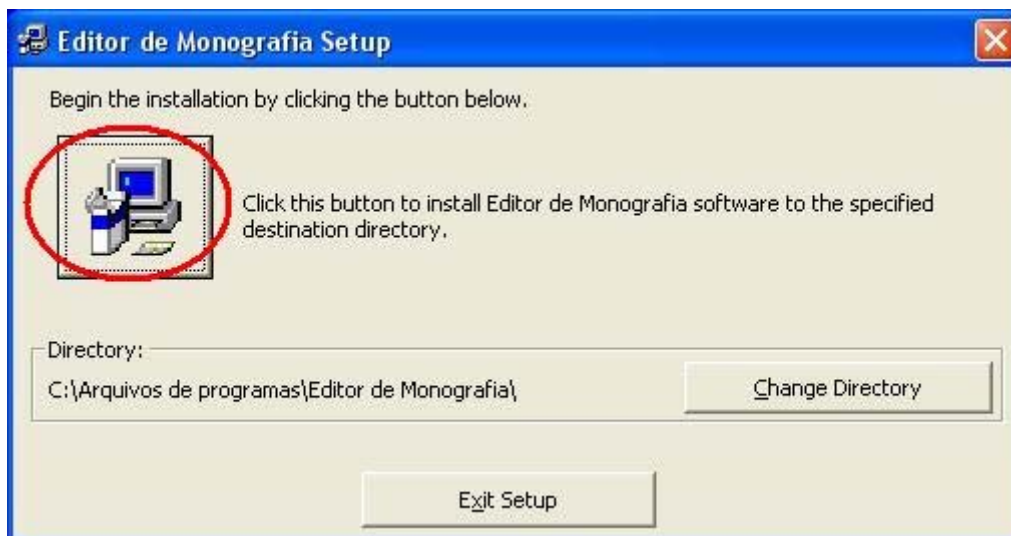
Figura 2. Tela para selecionar o diretório da instalação.

Na terceira tela (Figura 3) deverá ser escolhido o grupo de programas do software Editor de Monografia, por padrão já está selecionado o grupo Editor de Monografia, então é só clicar em Continue .