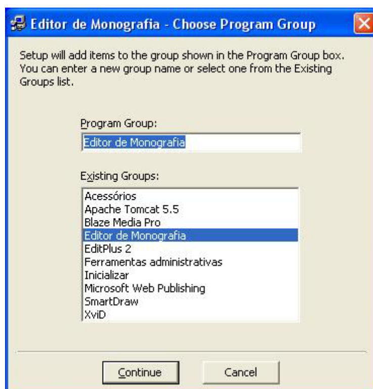
Figura 3. Tela para selecionar o grupo de programas.

Na terceira tela (Figura 3) deverá ser escolhido o grupo de programas do software Editor de Monografia, por padrão já está selecionado o grupo Editor de Monografia, então é só clicar em Continue .