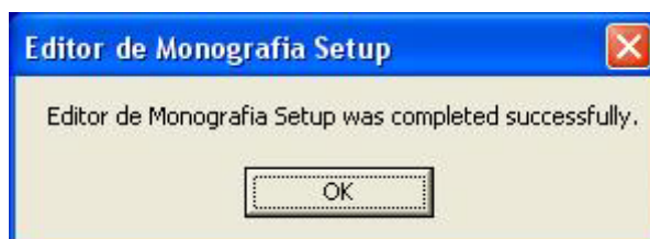
Figura 5. Tela final da instalação do software.

Pronto, a instalação do software Editor de Monografia foi concluída com sucesso (Figura 5).